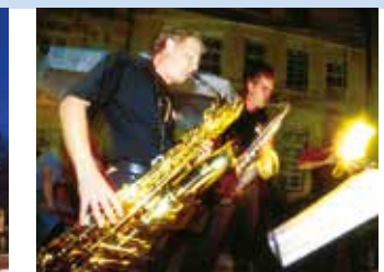
Weinfest mit Kulturangebot

Sie werden feststellen: Sie können viele sportliche und kulturelle Höhepunkte entdecken – ein rundum attraktives Freizeitangebot.