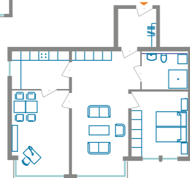
Beispiel: 3-Zimmer- Wohnung, ca. 80 qm